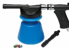
フォームスプレーヤー